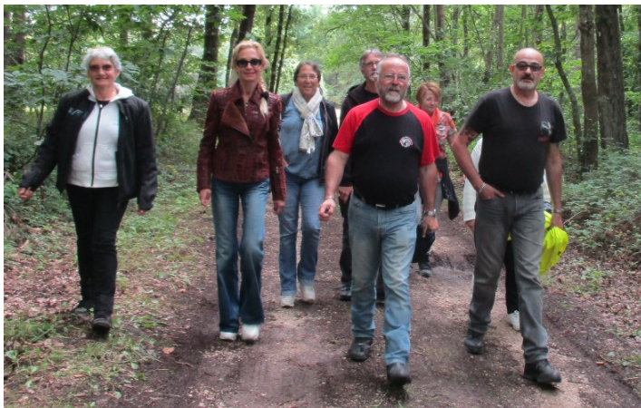
Balade à pied